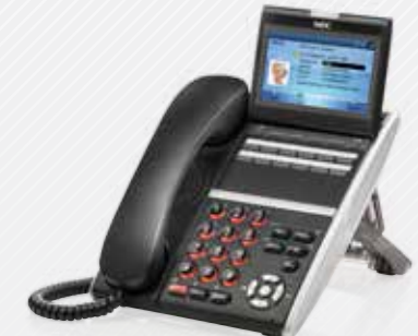
DT830CG Color Display