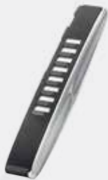
8-line Key Module