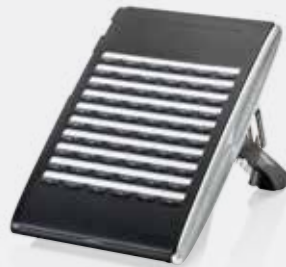
60-line DSS Console