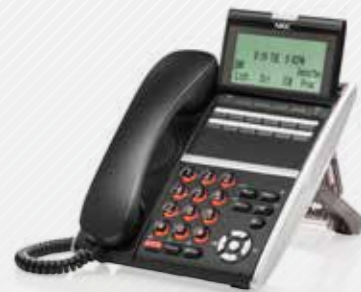
DT430 & DT830