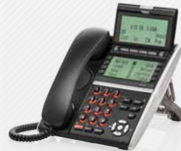
DT430 & DT830 Dual Display (Desi-less)